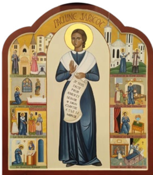
Bienheureuse Pauline Jaricot